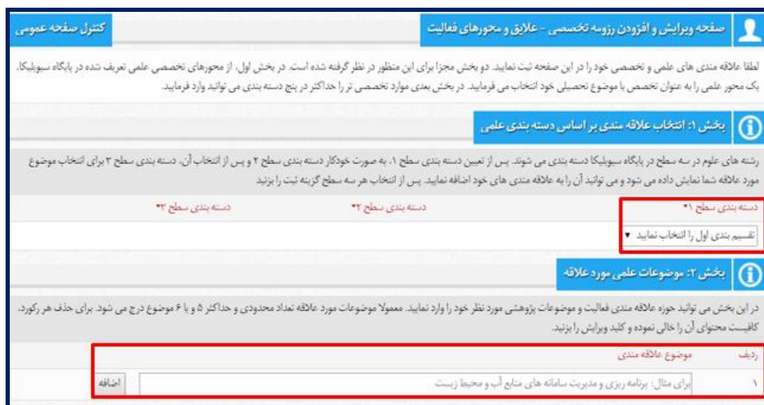
تصویر ۴. صفحه علایق و محورهای تخصصی

ویرایش موارد اضافه شده وجود دارد. تصویر ۴ بخش علایق و محورهای فعالیت کاربران در پایگاه سیویلیکا را نمایش می‌دهد.