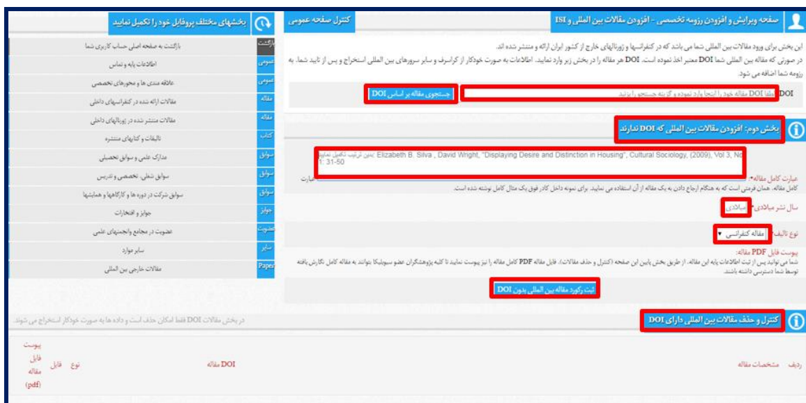
تصویر ۱۴. صفحه مقالات خارجی بین‌المللی

کاربران پس از تکمیل کلیه بخش‌ها با کلیک بر روی کنترل صفحه عمومی به صفحه رزومه تخصصی رزومه خود منتقل می‌شوند. همچنین با مراجعه به پروفایل کاربری به لینک صفحه تخصصی خود دسترسی پیدا می‌کنند و با کلیک بر روی "ویرایش اطلاعات رزومه تخصصی شما" می‌توانند رزومه خود را ویرایش نمایند (تصویر ۱۵).