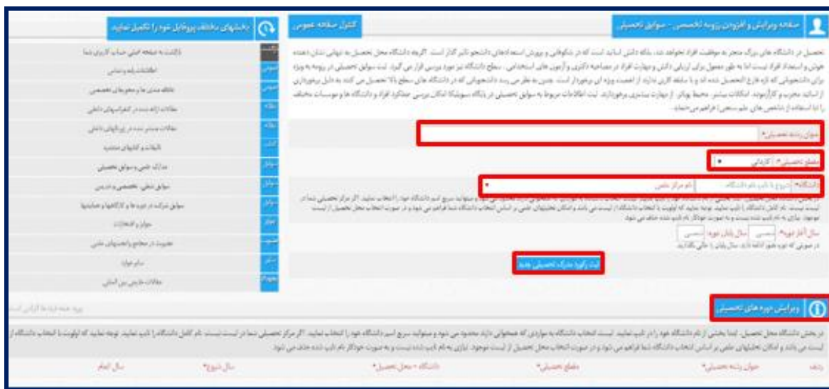
تصویر ۸ صفحه سوابق تحصیلی

در قسمت ویرایش دوره‌های تحصیلی فراهم است. تصویر ۸ صفحه سوابق تحصیلی کاربران در سیویلیکا را نمایش می‌دهد.