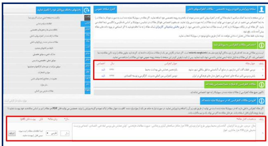
تصویر ۵. صفحه مقالات ارائه شده در کنفرانس های داخلی

هر مرحله امکان حذف و ویرایش موارد اضافه شده وجود دارد. تصویر ۵ صفحه مقالات کنفرانسی کاربران در پایگاه سیویلیکا را نمایش می دهد.