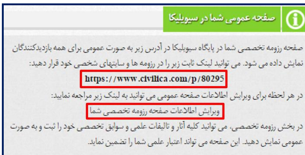
تصویر ۱۵. ویرایش اطلاعات رزومه و آدرس صفحه تخصصی

کاربران پس از تکمیل کلیه بخش‌ها با کلیک بر روی کنترل صفحه عمومی به صفحه رزومه تخصصی رزومه خود منتقل می‌شوند. همچنین با مراجعه به پروفایل کاربری به لینک صفحه تخصصی خود دسترسی پیدا می‌کنند و با کلیک بر روی "ویرایش اطلاعات رزومه تخصصی شما" می‌توانند رزومه خود را ویرایش نمایند (تصویر ۱۵).