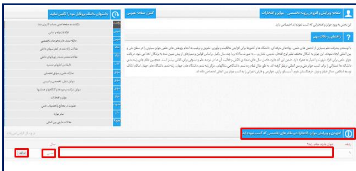
تصویر ۱۱. صفحه جوایز و افتخارات

اصلاحات را انجام دهید و سپس بر روی ویرایش کلیک نمایید. تصویر ۱۱، صفحه جوایز و افتخارات کاربران در پایگاه سیویلیکا را نمایش می‌دهد.